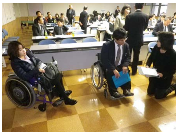
司会者との打合せ風景